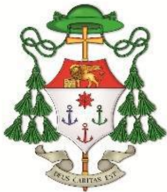
Beniamino Pizziol Vescovo di Vicenza