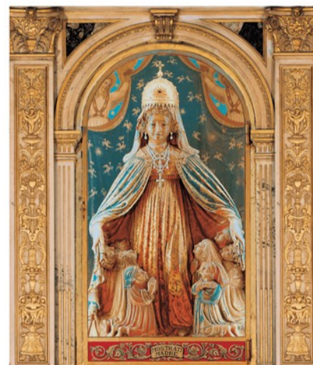
Madre di Misericordia Prega per Noi

ore 8.00 Santa Messa ad Araceli ore 10.00 Santa Messa a San Francesco ore 10.30 Santa Messa a Sant'Andrea ore 11.00 Santa Messa ad Araceli